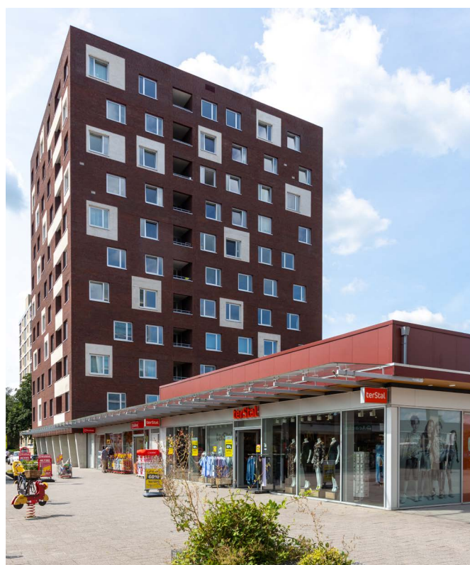
afbeelding 6. Een plint met voorzieningen.