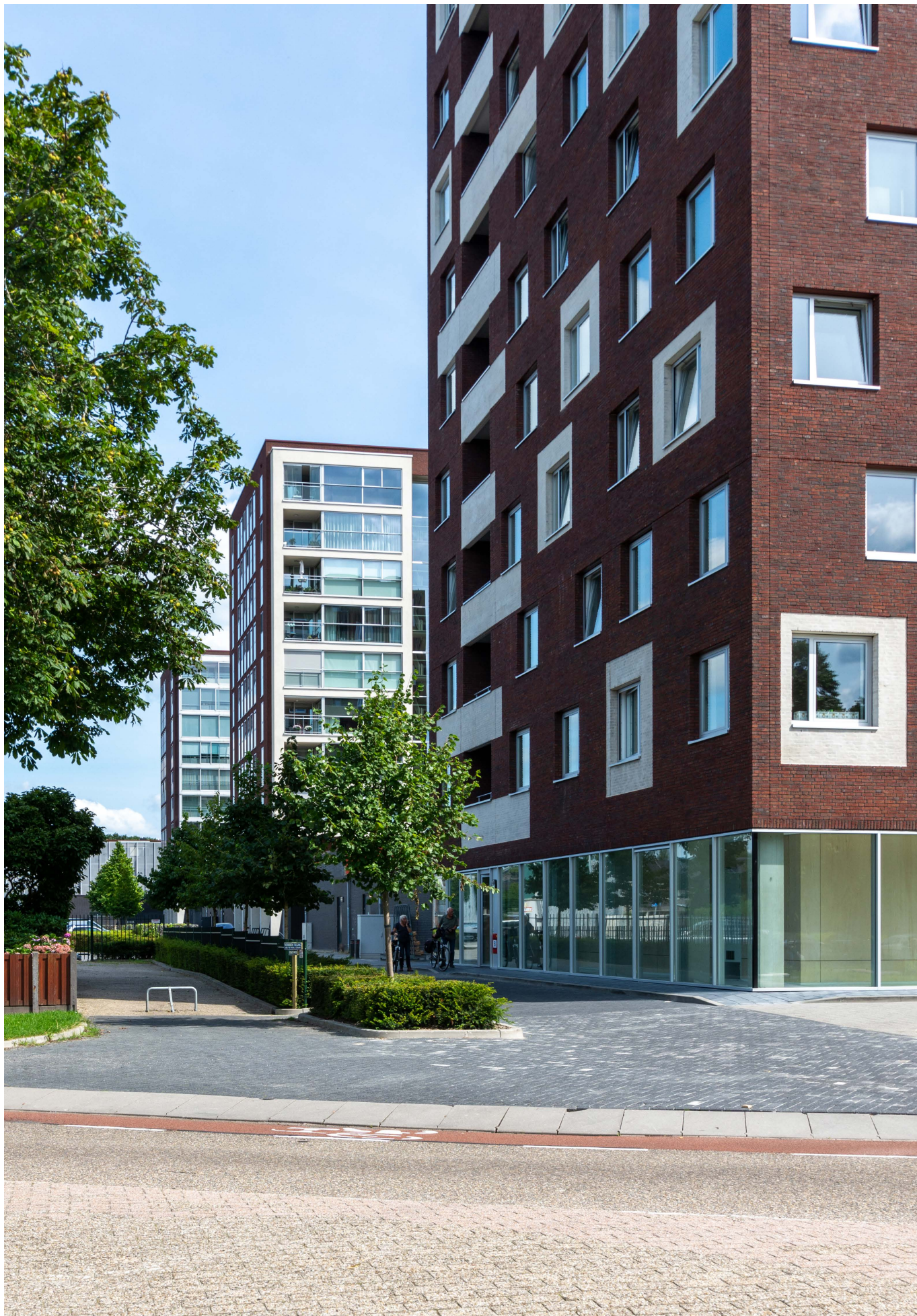
afbeelding 3. Drie woongebouwen op een plint met voorzieningen.