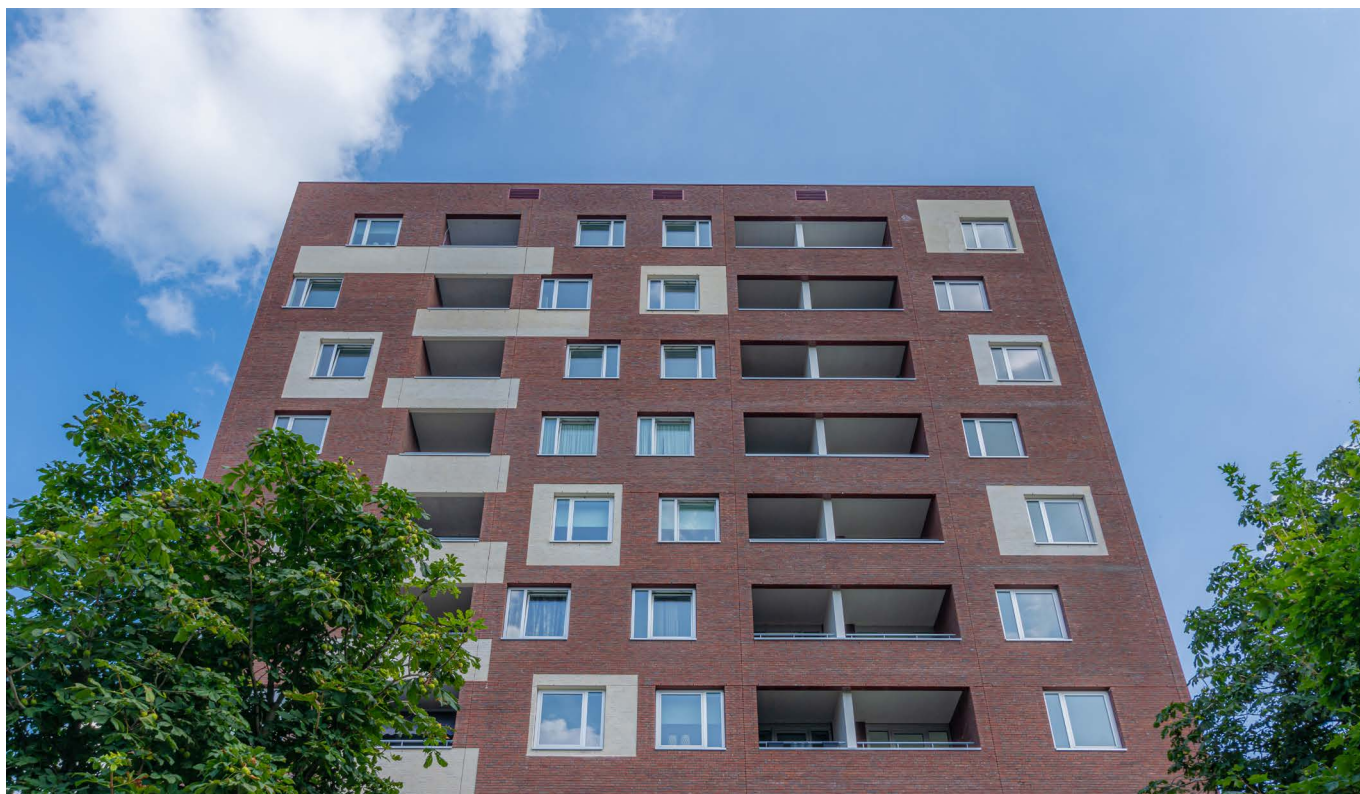
afbeelding 4. Een appartementengebouw zonder achterkanten.