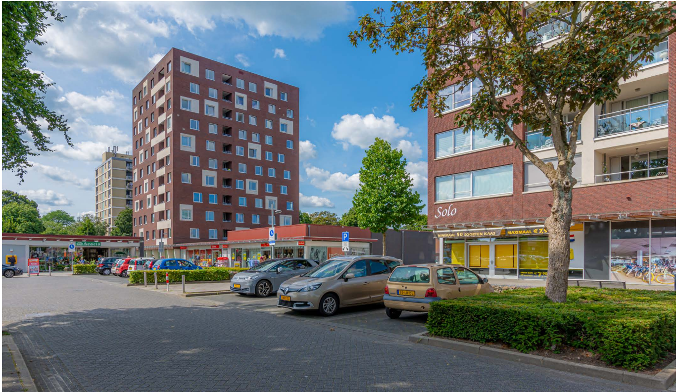
afbeelding 2. De Troubadour als afronding van het winkelcentrum.

Het appartementencomplex aan de Middenhaag wordt gekenmerkt door bebouwing op een winkelplint. Op de begane grond van de Troubadour is die transparante lijn doorgezet, maar heeft de winkelfunctie plaats gemaakt voor voorzieningen. Deze worden aangeboden vanuit Lefier voor de daarboven wonende bewoners. Per laag zijn zes woningen gerealiseerd. Er is gekozen om een alzijdig gebouw te ontwerpen waardoor het gebouw geen achterkanten kent. Elke woning bezit een eigen inpandige loggia waar de bewoners op een beschutte manier kunnen genieten van de buitenlucht. Met een hoogte van 35 meter vormt het de afsluiting van het winkelcentrum aan de westkant en zoekt het de relatie met de wijk aan deze zijde.