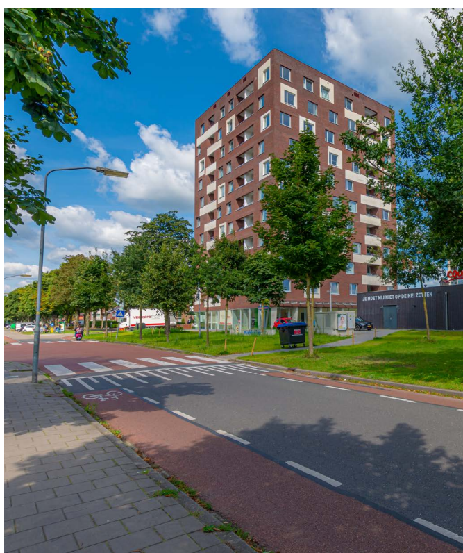
afbeelding 5. De Troubadour als afronding van het winkelcentrum.